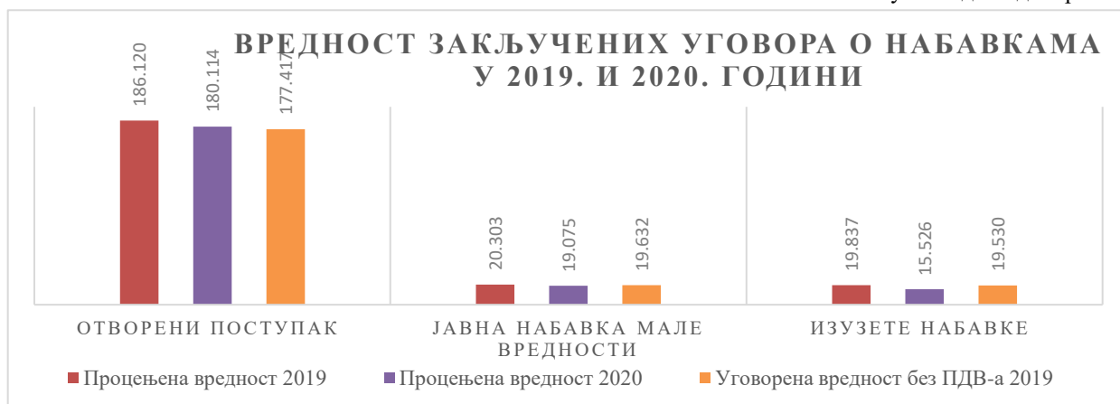
График број 2: Упоредни преглед процењене вредности и закључених уговора о набавкама у 2019. и 2020. години према поднетим извештајима Управи за јавне набавке 101 у хиљадама динара

Дом здравља је благовремено 26. јануара 2021. године објавио на Порталу јавних набавки податке о вредности и врсти јавних набавки из чл. 11–21. овог закона, и то по сваком основу за изузеће посебно, као и јавне набавке из члана 27. став 1. Закона о јавним набавкама за 2020. годину.